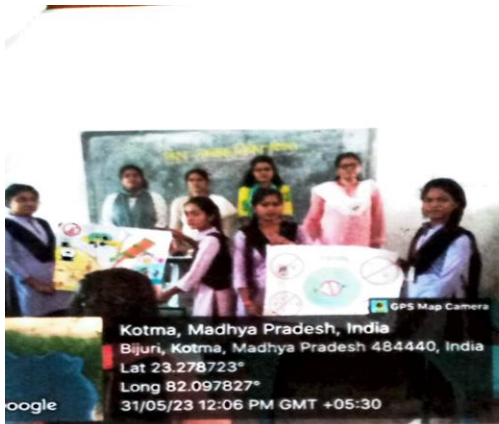
Kotma, Madhya Pradesh, India Bijuri, Kotma, Madhya Pradesh 484440, India Lat 23.278723° Long 82.097827° 31/05/23 12:06 PM GMT +05:30