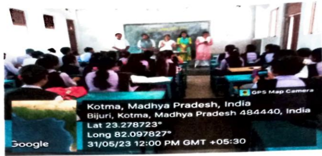
Kotma, Madhya Pradesh, India Bijuri, Kotma, Madhya Pradesh 484440, India Lat 23.278723° Long 82.097827° 31/05/23 12:00 PM GMT +05:30