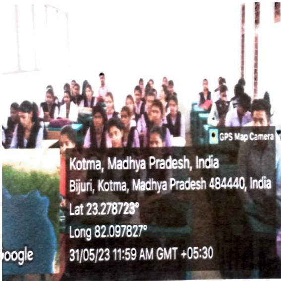
Kotma, Madhya Pradesh, India Bijuri, Kotma, Madhya Pradesh 484440, India Lat 23.278723° Long 82.097827° 31/05/23 11:59 AM GMT +05:30